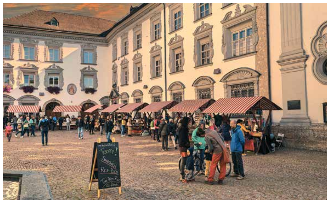
Vielfalt und Kreativität sind beim großen Nachtmarkt am Stiftsplatz garantiert: Am Freitag, 22. April beim Haller Nightseeing von 17 bis 23 Uhr.