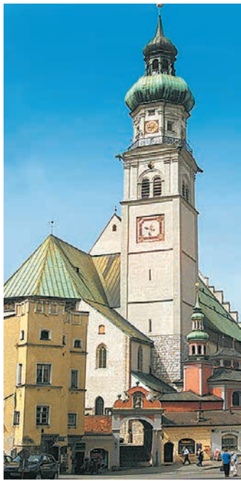
Das Benefizkonzert von "Findling" kommt der Pfarrkirche Hall zugute.

Ab 19:30 Uhr, jede Stunde in der Krippgasse bei Marcellos