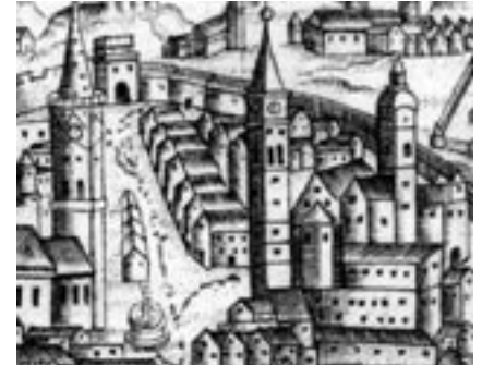
Bild: Hala Tyrolis ad Oenum (in: Guarinoni "Chyiosophiae academiae", Innsbruck 1648)

Um die in Hall drohende lutherische Reformation erfolgreich zu bekämpfen, hatten die Schwestern des Herrscherhauses, allen voran Erzherzogin Magdalena 1569 ein Kgl.Damenstift begründet und die Jesuiten, den damals wichtigsten neuen Orden der Gegenreformation nach Hall geholt. Die Suche nach dem Sinn des Lebens und der unzähligen Leiden und der Zerstörung, die Menschen sich gegenseitig und ihrer Welt bereiten, klingt in der ehemaligen Kirche der Jesuiten auf.