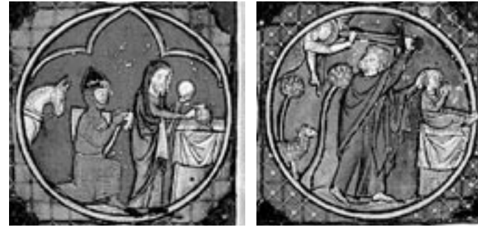
Gotische Bilderbibel (13.Jhd, Paris): Melchisedech's Siegesmahl aus Brot & Wein / Abraham & Isaak

Supra quae propitio ac sereno vultu respicere digneris: et accepta habere, sicut accepta .. Schau huldvoll darauf nieder mit gnädigem und mildem Angesicht und nimm es wohlgefällig an, wie Du einst mit Wohlgefallen aufgenommen hast die Gaben Abels, Deines gerechten Dieners, das Opfer unseres Patriarchen Abraham, das heilige Opfer und die makellose Gabe, die Dein Hoherpriester Melchisedech Dir dargebracht hat.