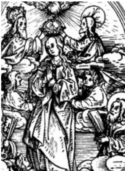
aus dem Haller Heiltumsbuch, Holzschnitt v. Hanns Bruckmair: Maria gekrönt; zu Füßen: Reliquiare der Sammlung