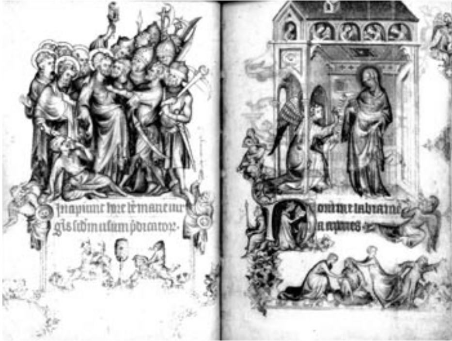
Gefangennahme Christi (f.15v) & Verkündigung Mariae (f.16r) aus Heures de Jehanne d'Evreux (1325)