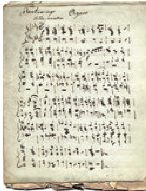
Alois Ballmann, Tantum ergo in F-Dur, Autograph um 1850, Orgelstimme.

Viele der in dem – nicht nur für Musikliebhaber interessanten – Beitrag vorgestellten Werke wären es wert, wieder aufgeführt zu werden, nicht zuletzt die Messen